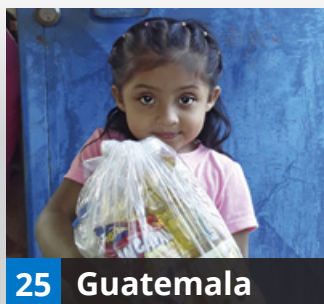
El amor rompe todas las fronteras / Otros